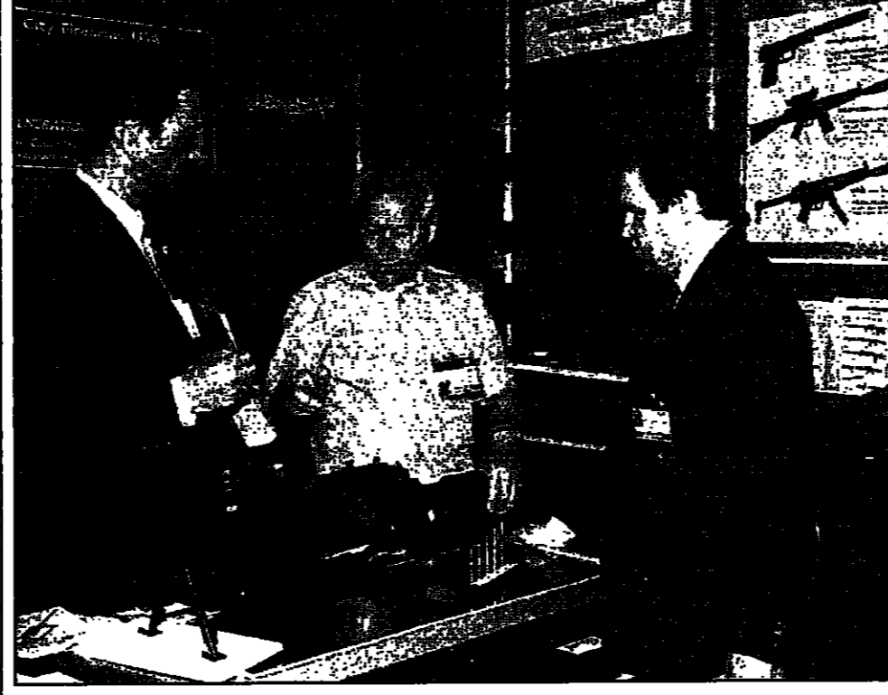
ميجال كلابشيكوف مصمم فرانس الروسي الشهير الكلاسيكوف في حديث مع الأمريكي لاري غارغليير حول الرشايش الثاني، اميرسا او 100 في اليوم الاخير لعروض الأسلحة في ابوظبي

القاهرة- رويترز، قال رفيق الحريري رئيس الوزراء اللبناني أمس ان أشخاصاً يزعم أنهم أعضاء في الجيش الأحمر اعتقلوا في بيروت في الشهر الماضي وسيحاكمون وسيقتلون عقوباتهم في لبنان. وقال الحريري الصحافيون لاجتماعه مع الرئيس المصري حسني مبارك في القاهرة، ان هؤلاء اللبنانيين من الجيش الأحمر، واضاف قائلاً انهم حصلوا على معلومات في بيروت وبعد ذلك ذهبوا الى لبنان. وتتهم السلطات اللبنانية الحريزي الخمسة بتزوير جوازات سفر وارتكاب مخالفات مالية لصل عقوباتها الى السجن عشرة اعوام. وابعاد احد اللبنانيين المتهمين صحية لجنائياتهم سيقتلون في السجن اذا قرر لبنان تسليمه لليابان. ولتنظيم لبنان واليابان اتفاقية لتسليم المتهمين.